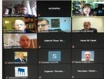
Sesión ordinaria del 7 de diciembre