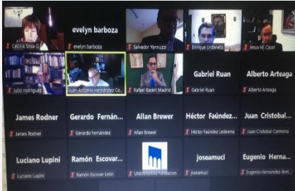
Sesión ordinaria del 21 de septiembre

Asalto al Parlamento Autor: Rafael Badell Madrid https://bit.ly/3uelhll