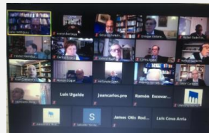
Sesión 16 de junio

PRONUNCIAMIENTO INTERACADEMICO A LOS RECIENTES ANUNCIOS SOBRE LA VACUNACIÓN CONTRA EL SARS-COV-2