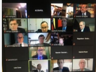
Sesión ordinaria martes 19 de enero de 2021