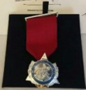
Diploma y medalla de la Academia Colombiana de Jurisprudencia.